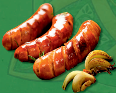
Chorizos Criollos (unidad) 3.00 €